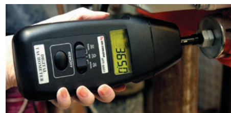
Рис. 4. Измерение скорости вращения контактным способом

Пользователю надо наклеить небольшой кусок светоотражающей лен-