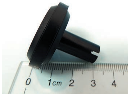
Рис. 5. Насадка диск

ты, которая идет в комплекте поставки, на поверхность вала. Этот кусок ленты будет служить метками при проведении измерений. Следует помнить, что вращающиеся механизмы являются источниками повышенной опасности, и контакт с ними может привести к тяжелой травме. Поэтому наклеивание меток и проверку прохождения меток через световой луч нужно делать только при выключенном двигателе и после полной остановки вала.