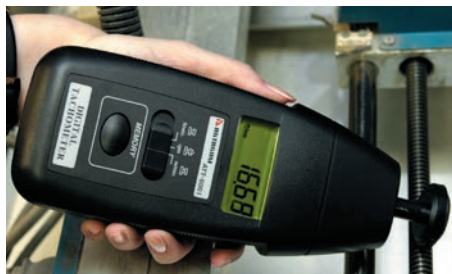
Рис. 6. Измерение линейной скорости

Далее включается двигатель, прибор устанавливается так, чтобы отраженный от метки световой поток попадал на датчик, расположенный в верхней торцевой части тахометра, и нажимается кнопка проведения измерений. Подтверждением того, что прибор фиксирует отраженные импульсы, является индикатор цели тахометра (рис. 8).