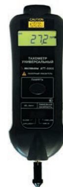
Рис. 9. Комбинированный тахометр АКТАКОМ АТТ-6006

Также следует отметить, что цифровые тахометры АКТАКОМ уже длительное время включены в Государственный реестр средств измерений, что подтверждает их качество и надежность. ☑