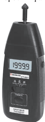
Рис. 1. Тахометр АКТАКОМ АТТ-6001

Соответственно, контактный способ измерения используется в тех случаях, когда пользователю доступна торцевая сторона вала и, обычно, он используется для валов с небольшими диаметрами. Идеальным прибором для измерения скорости вращения контактным способом является тахометр АКТАКОМ АТТ-6001 (рис. 1).