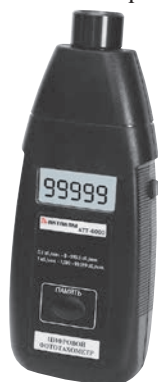
Рис. 7. Тахометр АКТАКОМ АТТ-6000

Если измеряемое значение частоты вращения очень мало (например, ниже 50 об./мин), то рекомендуется приклеить на ротор большее количество