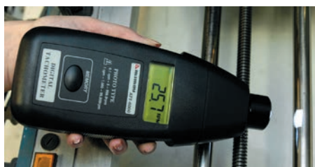
Рис. 8. Измерение скорости вращения бесконтактным способом

Однако в работе сервисных инженеров, особенно у тех, кто работает на производстве, часто возникает необходимость измерять скорости вращения валов различного диаметра и в различных условиях эксплуатации. Что делать в этом случае? Приобрести и носить с собой два прибора, один из которых контактный тахометр, другой — тахометр бесконтактного типа?