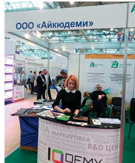
Стенд холдинга IQDEMY

новых клиентов и новых экспонентов, но, к сожалению, их ожидания не оправдались.