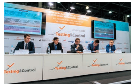
На конференции «Измерения. Испытания. Контроль»

В рамках выставки прошла Всероссийская научная конференция «Измерения. Испытания. Контроль» которая собрала на дискуссии ведущих научных сотрудников, специалистов и экспертов промышленных, строительных, экологических, научно-исследовательских лабораторий, сертификационных центров, конструкторских бюро, отделов технического контроля, стандартизации и метрологии из различных отраслей экономики.