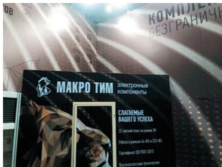
Стенд компании Макро Тим

понентов таких производителей как Samtec, Holt Integrated Circuits, Mini-Circuits, On Semiconductor, Analog Devices, NXP Semiconductors и многих других.