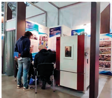
Стенд компании Hyde Science and Technology Limited

НМ-FMC является удобным средством, при помощи которого пользователи могут самостоятельно реализовать на уровне аппаратуры свои собственные алгоритмы приема, передачи и цифровой обработки информации. Модуль содержит ПЛИС Altera семейства Stratix III, узел генерации тактовых частот, память DDR3 объемом 8 Гбайт и 160-и контактный LPC соединитель для подключения FMC мезонинов. На выставке была также показана новая опция системы — поиск обрыва коаксиального кабеля. Эта опция стала доступна в системах серии ТЕСТ-9110 по стандарту AXIe и предназначена для поиска места обрыва коаксиального кабеля при его известной длине. Для реализации данной функции используется векторный анализатор цепей AXIe DPNA-6G. Определение текущего состояния кабеля осуществляется при помощи непрерывного измерения группового времени запаздывания всех элементов матрицы S-параметров. На стенде компании отметили высокий интерес посетителей к производимой холдингом продукции. Особенный интерес был к мезонину MIRIG, предназна-