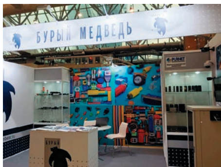
На стенде компании Бурый Медведь

Один из крупнейших поставщиков структурированных кабельных систем, активного и пассивного сетевого оборудования, а также электронных компонентов на российском рынке, компания Бурый Медведь ( www.brownbear.ru ) принимает участие в выставке уже не первый год. Продукция компании всегда вызывает большой интерес у посетителей выставок, т.к. ассортимент продукции (свыше 10000 позиций) предназначен для самого широкого круга потребителей — промышленные предприятия, монтажные организации, производственные объединения, системные интеграторы, проектовики.