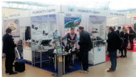
Стенд компании Магистр

Всегда пользуется повышенным интересом посетителей выставки компания Магистр ( www.magistr.su ). В этот раз посетители также смогли не только задать вопросы касательно выпускаемой продукции, но и испытать оборудование в работе. Особенно интерес вызвали аппараты точечной и