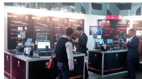
Экспозиция компании «Висом»

Компания «viZaar» ( www.vizaar.ru ), не впервые принимает участие в выставке. В этот раз компания продемонстрировала оборудование дистанционного визуального контроля, особенность которого заключается как в визуальном методе, так и магнито-порошковом и капиллярном методах. Данные приборы позволяют осматривать объекты глубиной до 30 метров и использовать всестороннюю артикуляцию управления головкой камеры зонда. Оборудование дистанционного визуального контроля viZaar Industrial Imaging AG