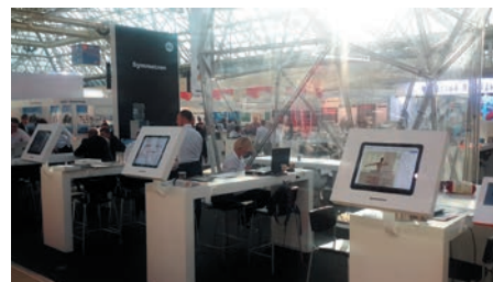
Экспозиция группы компаний «Симметрон»

На своем стенде группа компаний «Симметрон» ( www.symmetron.ru ) демонстрировала профессиональный инструмент Proskit и Bernstein (в том числе наборы и комплекты), паяльное оборудование Ersas, монтажный и электротехнический инструмент Greenlee, Klauke, Weicon, кабельные наконечники, продукцию для маркировки Brady, крепёжные элементы Essentra, корпуса для приборов и кабельные вводы Fibox, что вызвало большой интерес многочисленных посетителей. И, хотя аналоги представленной продукции присутствуют на российском рынке, компания «Симметрон» является одним из крупнейших поставщиков данного сектора.