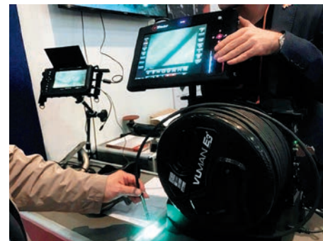
На стенде компании «viZaar»

ктроникс ( skard.ru ) с 2000 года производит многоканальные транспонаторы частоты в диапазоне от 9 кГц до 60 ГГц; радиоприемные устройства в диапазоне частот от 9 кГц до 110 ГГц; элементы антенно-фидерного тракта и антенно-фидерных систем в диапазоне частот от 9 кГц до 110 ГГц; измерительные антенны в диапазоне частот от 10 Гц (!) до 110 ГГц; а также комплексы радиомониторинга и радиотехнической обработки сигналов в диапазоне частот от 9 кГц до 60 ГГц. Благодаря собственной материально-технической базе, новаторским идеям и потенциалу сотрудников предприятия, компания смогла разработать импортозамещающую продукцию, отвечающую высоким требованиям к качеству, внешнему виду и функциональным возможностям производимого оборудования.