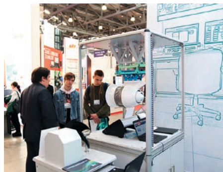
На стенде НПП «МЕРА»

«Научно-производственное предприятие «МЕРА» ( www.nppmera.ru ) — известный российский разработчик и поставщик бортовых измерительных систем, управляющих и измерительных систем для промышленных