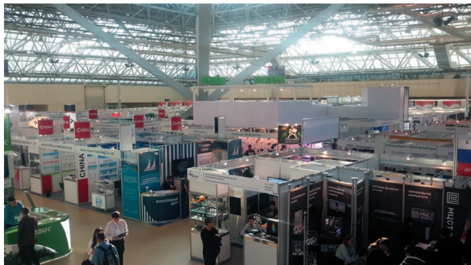
В павильоне выставки

С 16 по 18 октября 2019 года в ЦВК «Экспоцентр» в павильоне «Форум» прошла 17-я международная выставка