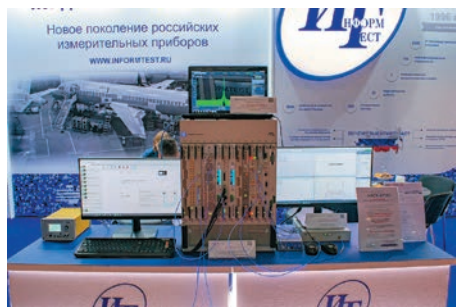
На стенде холдинга «Информтест»

Холдинг «Информтест» ( www.informtest.ru ) являющийся российским производителем телеметрических систем, специализируется на разработке, изготовлении, интеграции и обслуживании систем контроля качества монтажа и систем функционального контроля бортовых комплексов для аэрокосмической отрасли. В этом году компания представила новую разработку — мезонинный модуль