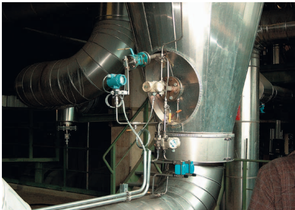
Рис. 2. Сенсор ERS высокого давления, установленный внизу резервуара

For accurate and fast level measurements in rectification columns and in any other high tanks without impulse lines and capillaries and regardless of the ambient temperature Emerson provides unique solution with digital architecture.