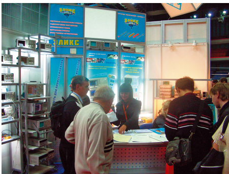
Экспозиция компании ЭЛИКС

В выставке приняли участие компании из России, Ирландии, Дании, Франции, США, Китая, Нидерландов, Великобритании.