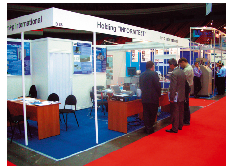
Стенд холдинга «Информтест»

Новейшие разработки, уникальные методики и насыщенная деловая программа, представленная семинарами и презентациями, привлекли более пяти тысяч посетителей из всех секторов авиакосмической, автомобильной, машиностроительной, оборонной, металлургической, нефтеперерабатывающей, судостроительной промышленности. Посетители из разных регионов России получили возможность обменяться опытом, а также ознакомиться с продукцией ведущих отечественных и мировых производителей.